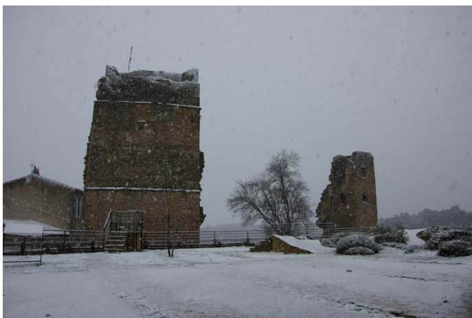
Flocons imprévus ....et fugaces sur Saint Martin le Vieil le 18 janvier 2016.

La lettre du Président détaille les motivations de ce choix. On peut en lire le détail sur le site www.saintmartinlevieil.fr , à la rubrique « actualité ».