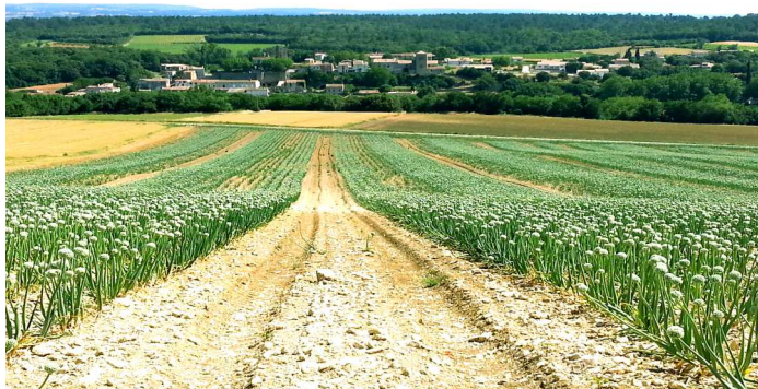
Le village vu des champs d'oignons en fleurs

Elle s'est déroulée le samedi 7 novembre. Suivant la tradition, la messe était suivie de la cérémonie devant les monuments aux Morts. Le verre de l'amitié rassemblait la population et la soirée faisait place au repas dansant. Belle organisation du Comité des Fêtes qui a bien mérité de son appellation!