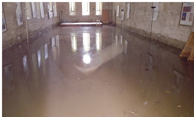
L'ancien réfectoire des moines sous 1 mètre d'eau.

Lors des dramatiques inondations qu'a connu l'Aude au mois d'octobre notre village, à un degré moindre a subi des dégradations lors du débordement de la Vernasonne sur le site de Villelongue. Il en résulte des dégâts tant sur le domaine public (pas d'éclairage public) que privé au niveau de l'Abbaye et des habitations à proximité.